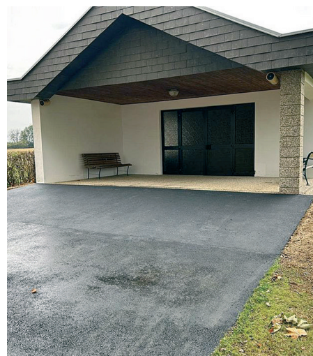
Leichenhallen: Neugestaltung des barrierefreien Zuganges in Welgersdorf (rechts) und Miedlingsdorf (links) durch die Bauhofmitarbeiter der Marktgemeinde Großpetersdorf.