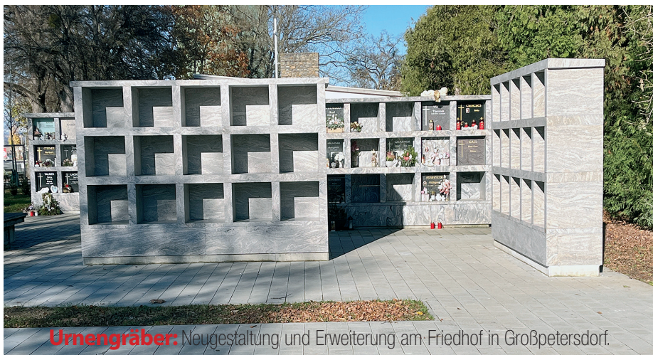
Urnengräber: Neugestaltung und Erweiterung am Friedhof in Großpetersdorf.

Die Vorlagen zur Antragstellung wurden vom Referat Sozial- und Klimafonds der Burgenländischen Landesregierung neu aufgelegt und unter www.grosspetersdorf.at zum Download zur Verfügung gestellt.